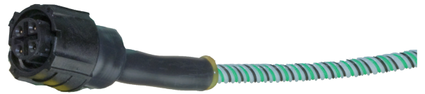
Connecteur côté femelle